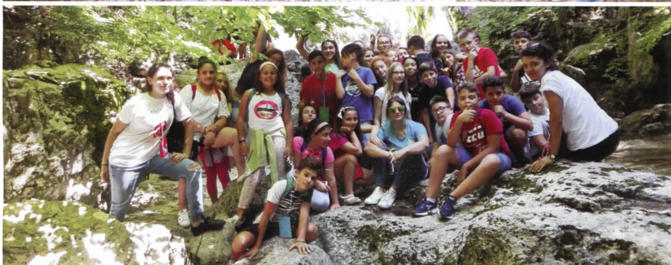
3 Agosto: escursione verso le Cascate di Giovanni Paolo II