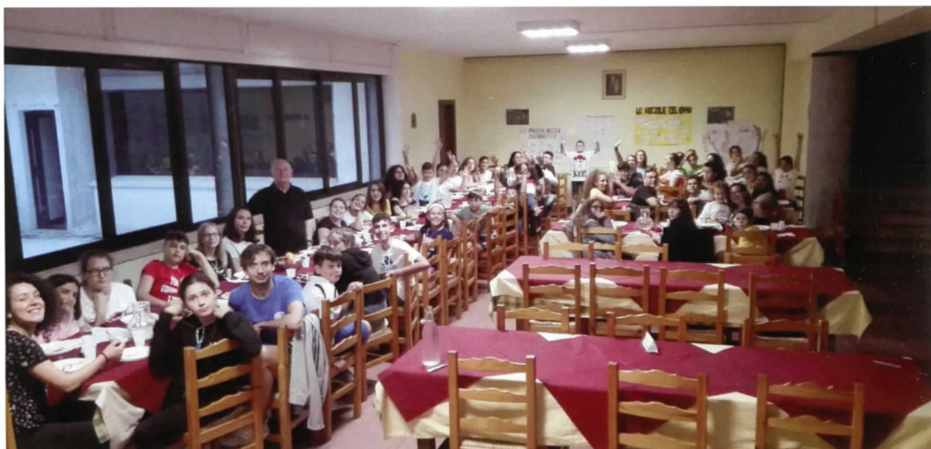
Momento conviviale dei ragazzi nella grande sala da pranzo del Santuario