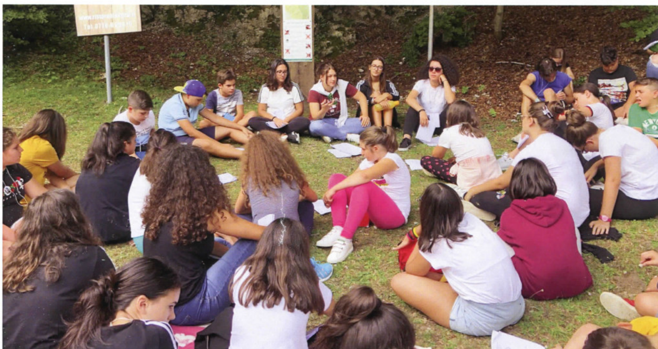
4 Agosto: momento di riflessione dei ragazzi