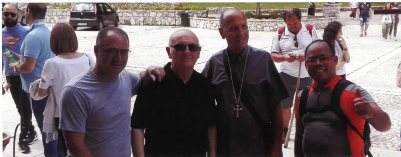
1 Agosto: il nostro Vescovo Mons. Gerardo al termine del Camino dei Giovani con don Luigi

In questo numero di settembre la cronaca la scrivono le numerose foto del Campo Giovani e Ragazzi di Canneto dal 1° al 5 agosto 2018 che mi dispensano di aggiungere altre parole.