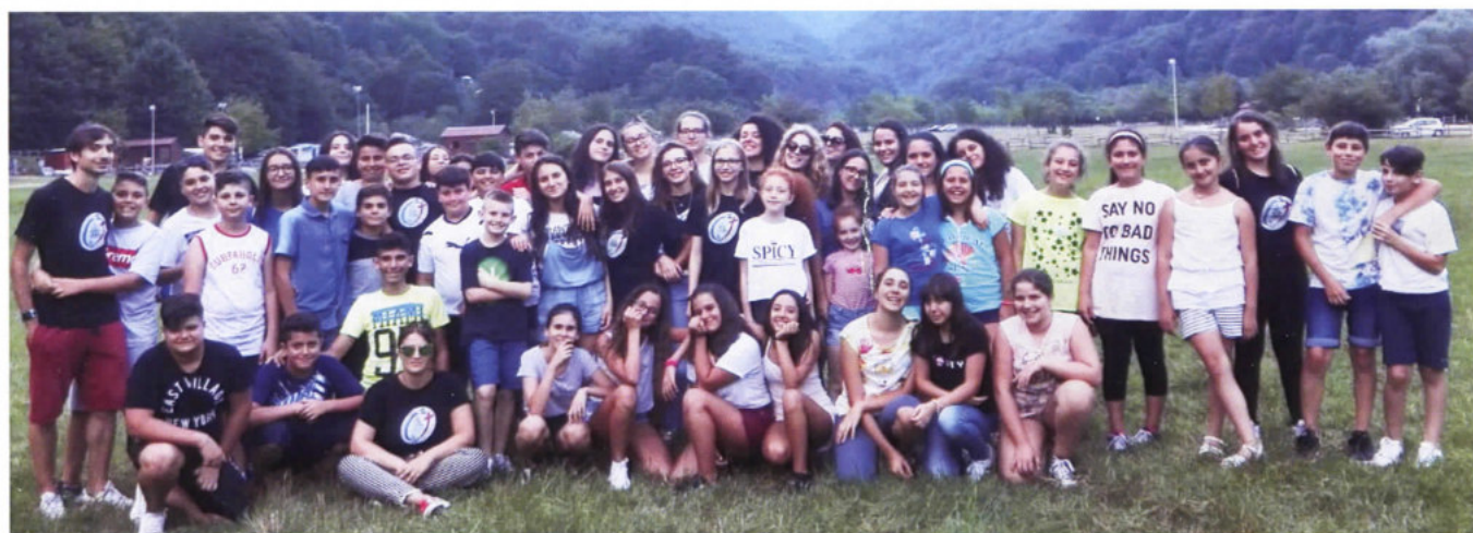
2 Agosto: foto di gruppo dei giovani e ragazzi nella Valle di Canneto